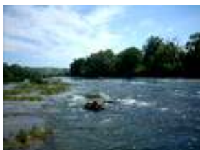
Слике: Ријека Уна

Ријека Уна извире у селу Доња Суваја испод планине Чемернице у Републици Хрватској, а улијева се у ријеку Саву поред Јасеновца. Укупна дужина ријеке Уне износи 212 km, а укупна дужина водотока ријеке Уне на подручју општине Костајница износи цца 16 km. У овом дијелу Уна има обиљежје мирније низинско - панонске ријеке и све је плића улијед таложена кречњака који ствара седру. Ријека Уна погодује различитим спортско-рекреативним активностима као што су купање, риболов, возња чамцима, а посебно је атрактивна током љетних мјесеци када њену обалу преплави мноштво купача и излетника.